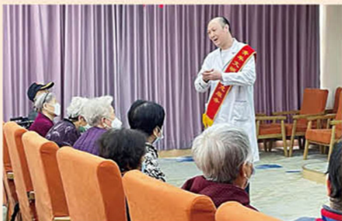
3月7日下午，省精卫中心“开心工程”来到保定泰康颐养中心，为老人们带来了睡眠知识普及和义诊等志愿服务。据悉，省精卫中心持续在院内外广泛深入开展精神卫生领域政策和心理健康知识的普及和推广，让学雷锋志愿服务活动融入日常、化作经常。