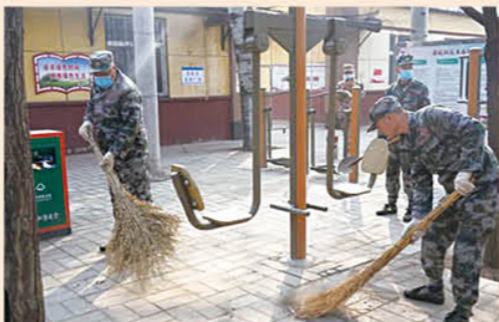
3月5日下午，河北省荣军医院联合71282部队开展“军民鱼水情、共建一家亲”学雷锋志愿服务活动。活动中，优抚对象和部队官兵一起弘扬践行雷锋精神，诠释了新时代雷锋精神的崭新风貌，展示了军人官兵听指挥、能吃苦、作风硬的优良形象。