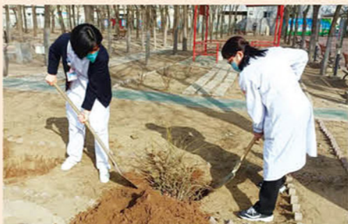
开滦精神卫生中心组织“我为医院添新绿”植树节主题党日活动。活动的开展增强了医院党员干部的凝聚力和战斗力，发挥党员的先锋模范作用及员工的团结协作精神，为美化医院环境，增加患者和家属的就医感受做出了贡献。