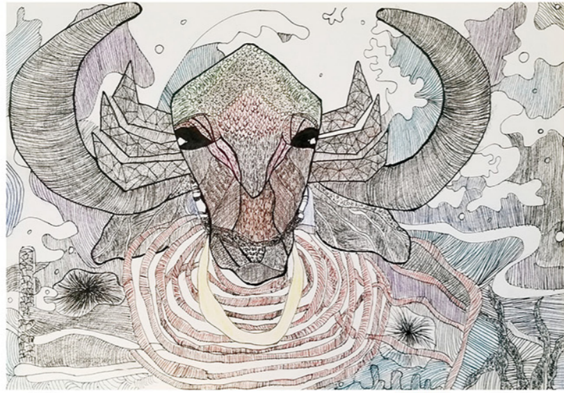
线描 五色神牛 郝钟画

子丑年来腾锦绣，鼠归牛到竞辉煌。我知道，我们的省六院，我们每个人，心中都有一个自己的牛，都在描绘很牛的自己，牛年画牛牛更牛，那就拿起画笔，画一头牛给自己，也给自己的家人、朋友，还有整个世界看看吧。（赵向辉）